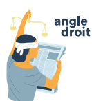
Droits de l'Homme