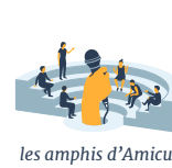
Cours du soir